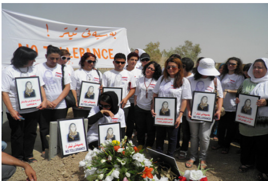
Demonstration am Grab von Nigar Rahim, Foto: www.asuda.de, 08.2012

Aber politische Willensbekundungen und Rechtsreformen allein reichen nicht aus, um die Lebenswirklichkeit von Frauen und Mädchen in Kurdistan-Irak zu verändern. Unser Projektpartner – das Frauenzentrum KHANZAD in Sulaimania - und zahlreiche lokale Frauenorganisationen kritisieren die schleppende Umsetzung des Gesetzes. Traditionelle und religiöse Strukturen blockieren seine Anwendung. Insbesondere in ländlichen Regionen gibt es kaum Rechtsbeistand oder Zufluchtsmöglichkeiten für bedrohte Frauen; in bestehenden staatlichen Anlaufstellen sind Schutz und Betreuung unzureichend.